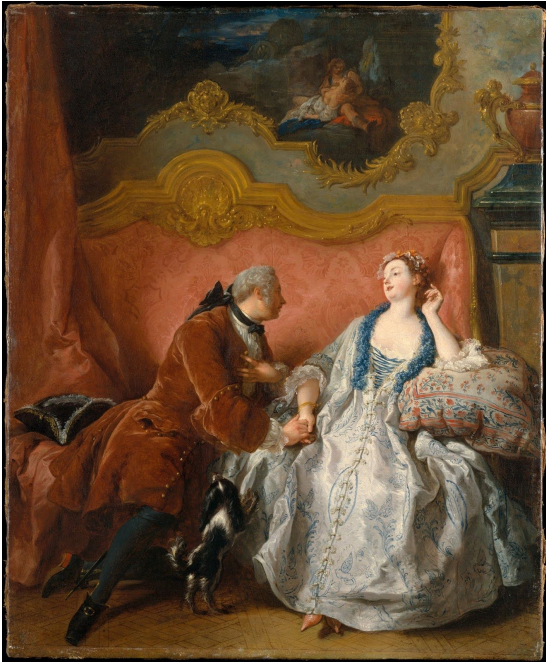
Jean François de Troy - Deklaracja miłości , 1724

Ukazana na obrazie kobieta na pewno nie jest panną. Biorąc pod uwagę jej wiek, pewność siebie i kokieteryjny ubiór, mamy tu do czynienia albo z mężatką, albo wdową. Być może także wyznając jej miłość mężczyzna jest żonaty. W świecie XVIII-wiecznych wyższych sfer "miłość" była bowiem najczęściej zajęciem osób pozostających w związkach małżeńskich, co wiązało się ze specyficznym podejściem do samej zdrady. Tym samym w większości przypadków, kiedy będziemy mieć do czynienia z "deklaracją miłości", czy to w dziele literackim, czy malarskim, nie dajmy się zwieść pozornej niewinności i wzniosłości słów i gestów. Ubrane w piękne słowa wyznanie miłości stanowiło wówczas rodzaj propozycji romansu, który miał trwać "dopóki nuda nas nie rozłączy"